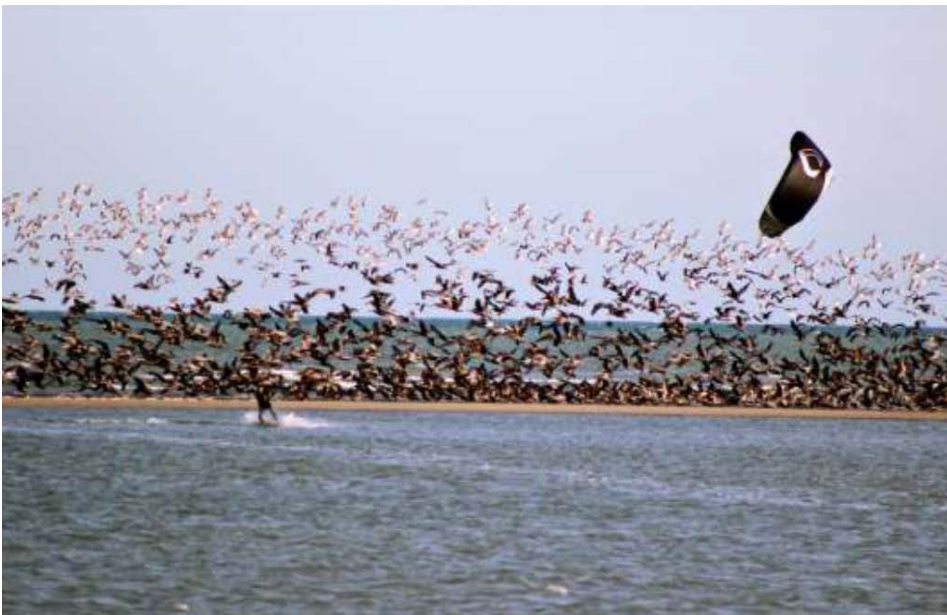
Abbildung 2: Trendsportart Kitesurfen im Konflikt mit dem Küsten- und Meeresnaturschutz.

In der Vergangenheit beschäftigten sich wissenschaftliche Untersuchungen mehrheitlich mit anderen Wassersportaktivitäten wie Windsurfing oder Bootsverkehr (MADSEN 1998) oder auch Störungen durch Spaziergänger und Hunde (GOMPPER 2014). Aus jüngerer Zeit liegen erste Studien vor, die sich explizit mit den Auswirkungen des Kitesurfens auf Vögel beschäftigen (Abb. 2).