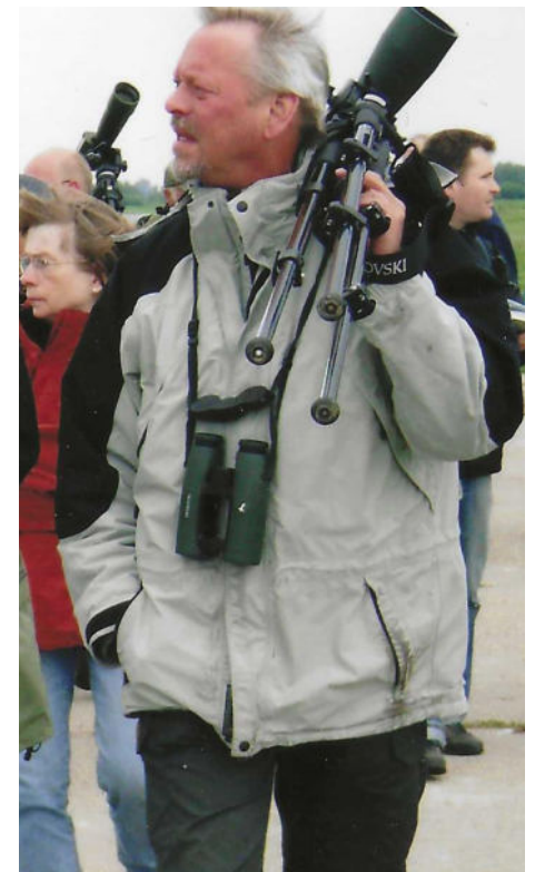
Fotos: Eckhard Skopnik (o.l.), Brigitte Soost-Leischke (u.r.), Grafik (o.r.): Canva

Jene Natur, deren Einzigartigkeit er mit jedem Atemzug und Herzschlag erlebte und für die er seine Stimme erhob. Nun ist sie verstummt. Aber unvergessen. Der NABU, wie er heute dasteht, verdankt Jochen Ropers unendlich viel, in Cuxhaven wie in ganz Niedersachsen.